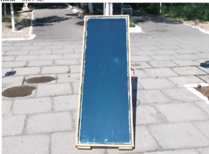
Рис. 2. Внешний вид солнечного воздухонагревателя

Для решения данной задачи был изготовлен плоский солнечный воздухонагреватель (рис.2), размеры которого составляют: ширина коллектора – 0,5 м. протяженность коллектора – 1,5 м и высота канала – 0,07 м.